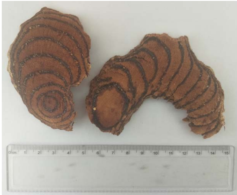
图A.1 鸡血藤药材一等品