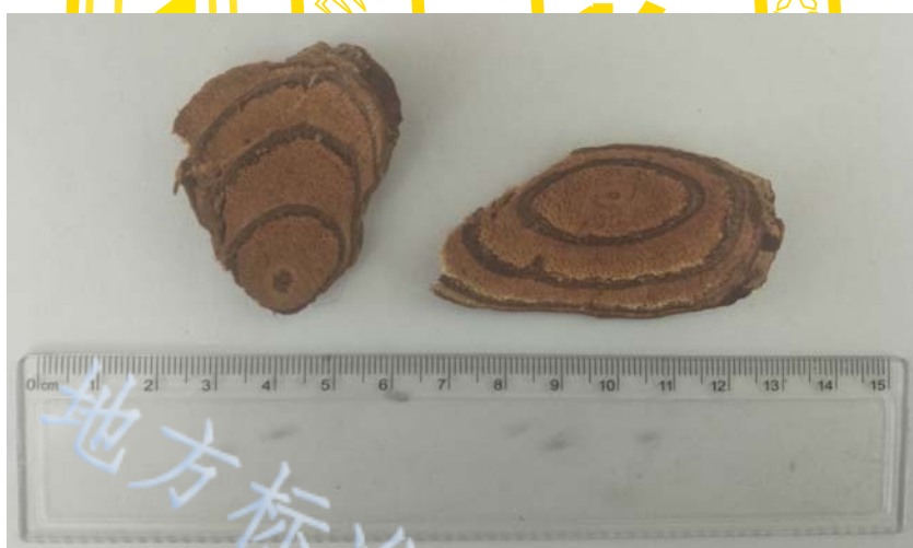
图A.4 鸡血藤药材末等品