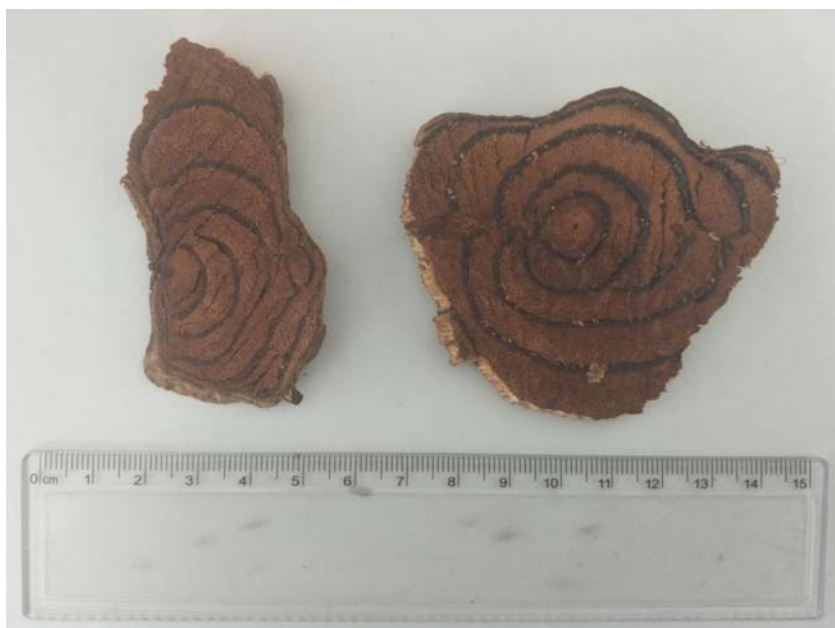
图A.3 鸡血藤药材三等品