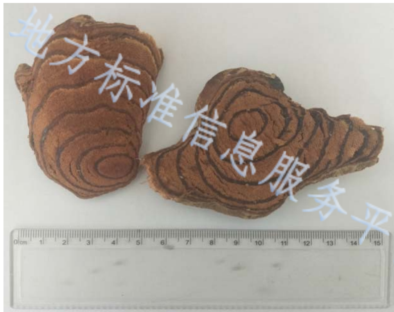
图A.2 鸡血藤药材二等品