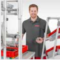
精益生产装配系统