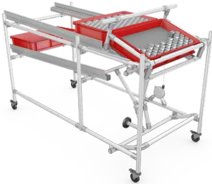
脚踏式LCIA 低成本自动化材料搬运系统