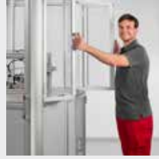
MB工业铝型材装配系统