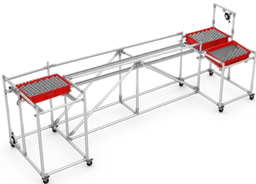
LCIA 低成本自动化转角式回转架