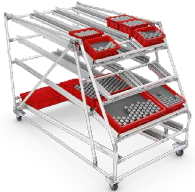
FIFO 先进先出线边料架