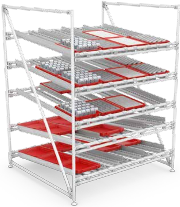
FIFO 先进先出仓库料架