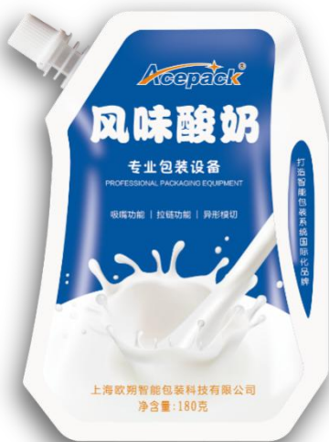
新型斜吸嘴自立袋包装