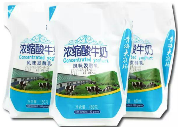
目前流行包装包装