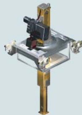
ATL 1000 E