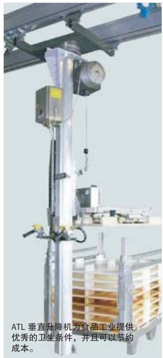
ATL 垂直升降机为食品工业提供优秀的卫生条件，并且可以节约成本。

本刊仅作一般参考之用，我们保留在任何时间更改产品设计和规格的权利。本出版物的任何声明，无论是明示或暗示，都不应被解释为任何产品用于某种特定用途的适合性、适销性、品质或任何销售协议条款的声明之担保或条件。