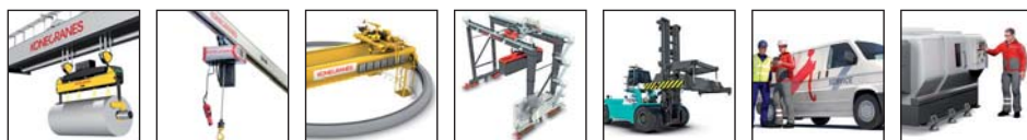
工业起重机 轻型起重设备 核电起重机 港口起重机 重型叉车 起重设备服务 机床服务