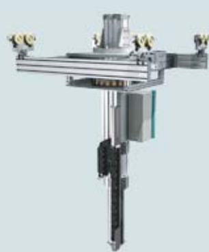
ATL 200 P