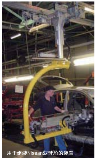
用于组装Nissan驾驶舱的装置